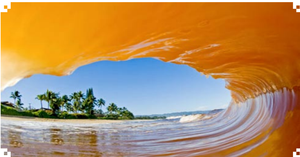
„Die Wissenschaft des Reichwerdens“ von Wallace D. Wattles

„Was ich mir wünsche, wünsche ich auch allen anderen!“